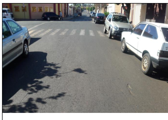
Foto 21: Vista de trecho da Rua Domingos Carloni Bairro: Vila Cláudia