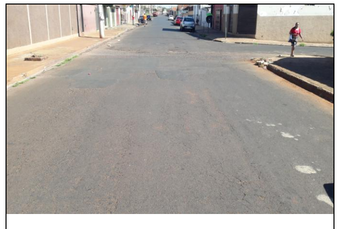
Foto 40: Vista de trecho da Rua Raulino de Medeiros Marques - Bairro: Nova Cravinhos