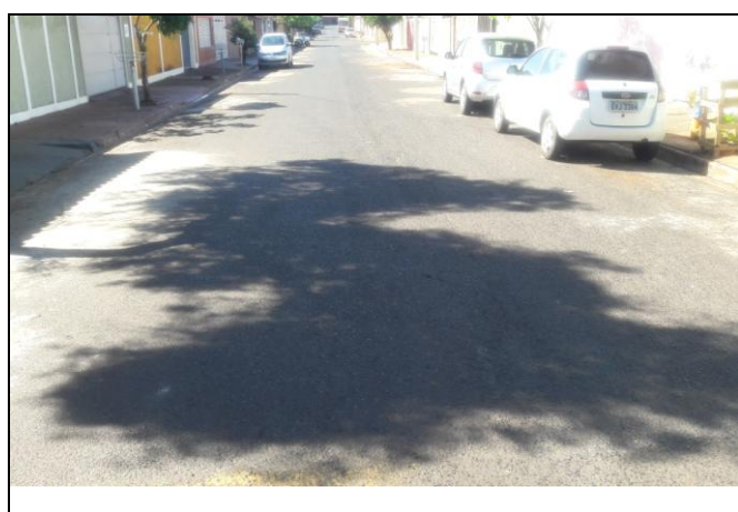
Foto 09: Vista de trecho da Rua Ormino Salomão Bairro: Vila Cláudia