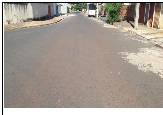
Foto 06: Vista de trecho da Rua João Bizutti Bairro: Vila Cláudia