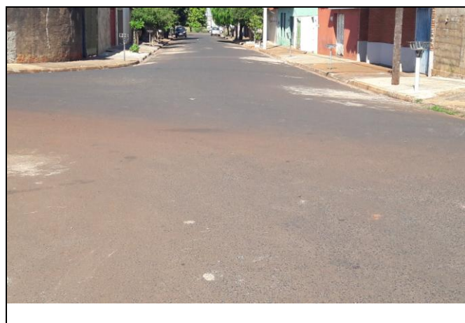
Foto 01: Vista de trecho da Rua Domingos Rizzo Bairro: Vila Cláudia