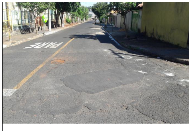
Foto 13: Vista de trecho da Rua Pedro Bagatin Bairro: Vila Cláudia