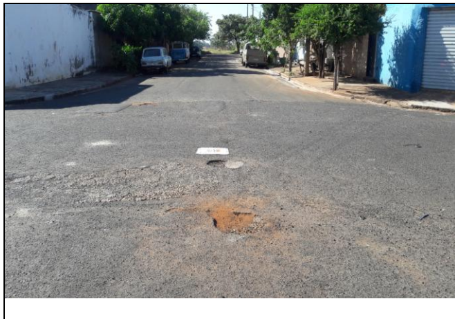
Foto 31: Vista de trecho da Rua Adriano dos Santos Bairro: Vila Cláudia