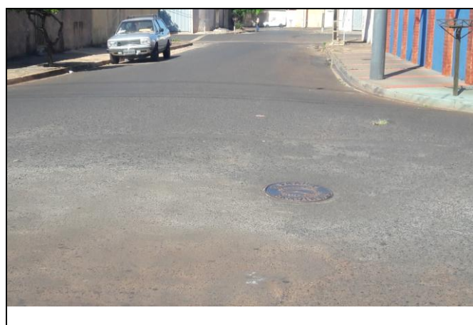
Foto 23: Vista de trecho da Rua Dr. Manoel Arantes Nogueira Bairro: Vila Cláudia