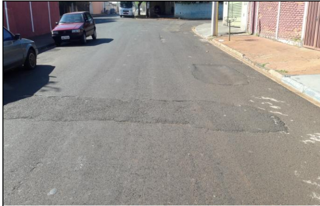
Foto 25: Vista de trecho da Rua Antonio da Silva Bairro: Vila Cláudia