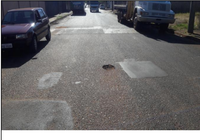
Foto 37: Vista de trecho da Rua Santi Pieri Bairro: Jardim Primavera