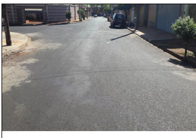
Foto 10: Vista de trecho da Rua Domingos de Almeida Vieira Bairro: Vila Cláudia