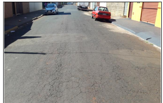
Foto 30: Vista de trecho da Rua Afonso Garbelini Bairro: Vila Cláudia