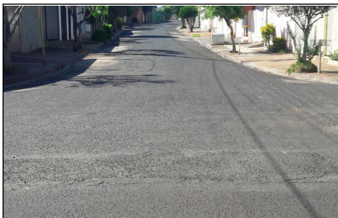
Foto 29: Vista de trecho da Rua Antonio Lopes Bairro: Vila Cláudia