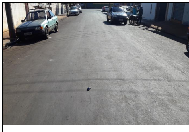
Foto 17: Vista de trecho da Rua Angelo Batiston Bairro: Vila Cláudia