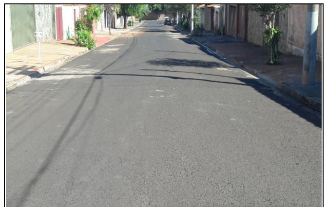
Foto 28: Vista de trecho da Rua Antonio Lopes Bairro: Vila Cláudia