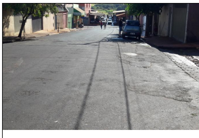
Foto 15: Vista de trecho da Rua José Bento Pereira Bairro: Vila Cláudia