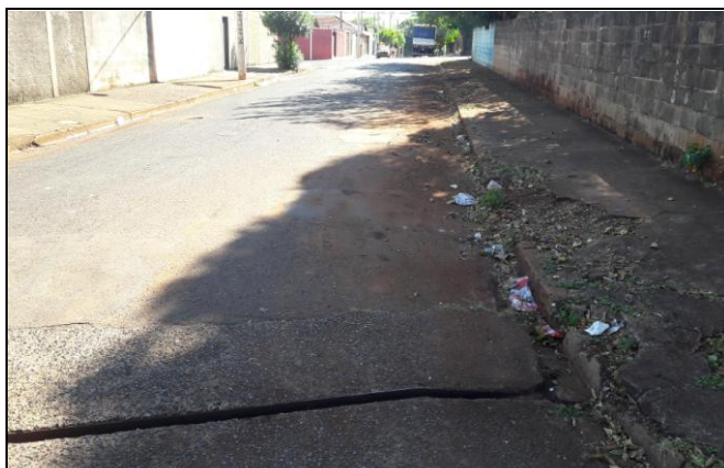
Foto 27: Vista de trecho da Rua Antonio de Oliveira Junior Bairro: Vila Cláudia