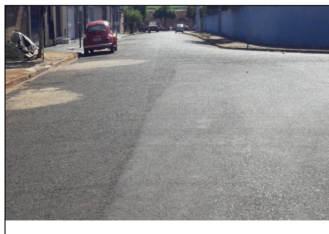
Foto 04: Vista de trecho da Rua Victório Campioni Bairro: Vila Cláudia