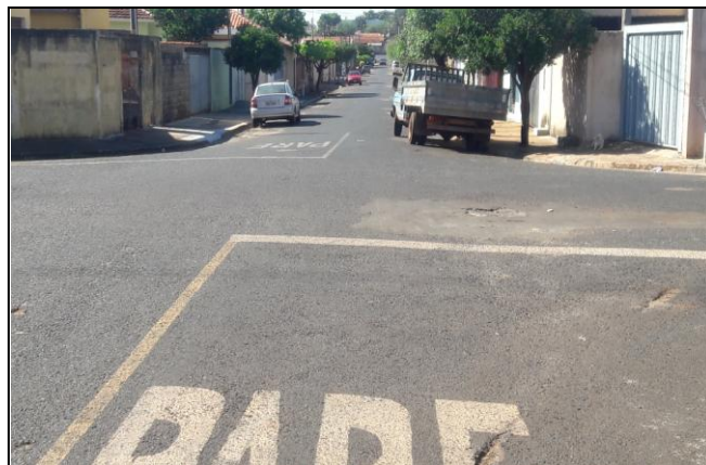
Foto 08: Vista de trecho da Rua Luiz A. da Silva Bairro: Vila Cláudia