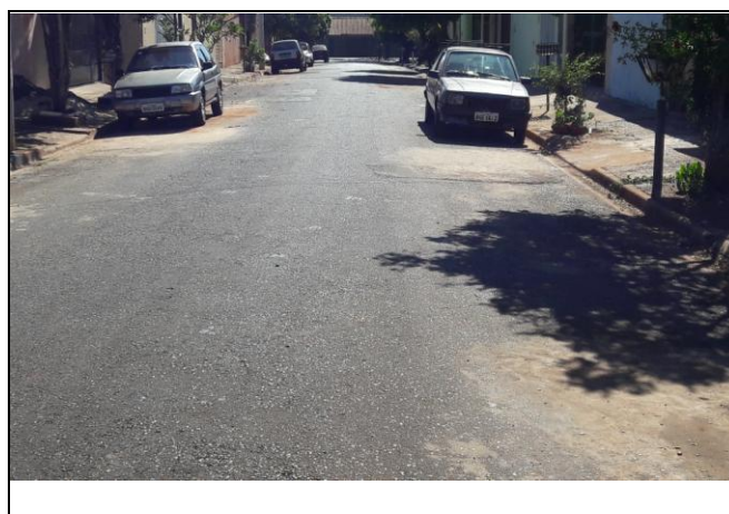
Foto 02: Vista de trecho da Rua Domingos Rizzo Bairro: Vila Cláudia