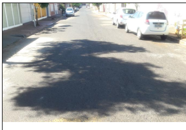
Foto 20: Vista de trecho da Rua José Marques Bairro: Vila Cláudia