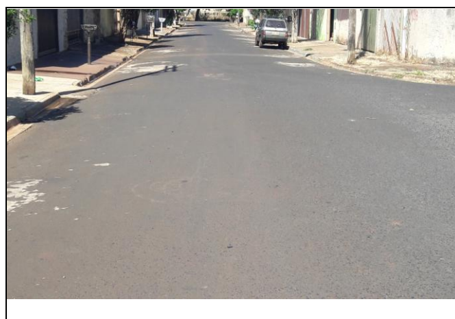
Foto 03: Vista de trecho da Rua Victório Campioni Bairro: Vila Cláudia