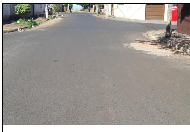
Foto 11: Vista de trecho da Rua Domingos de Almeida Vieira Bairro: Vila Cláudia