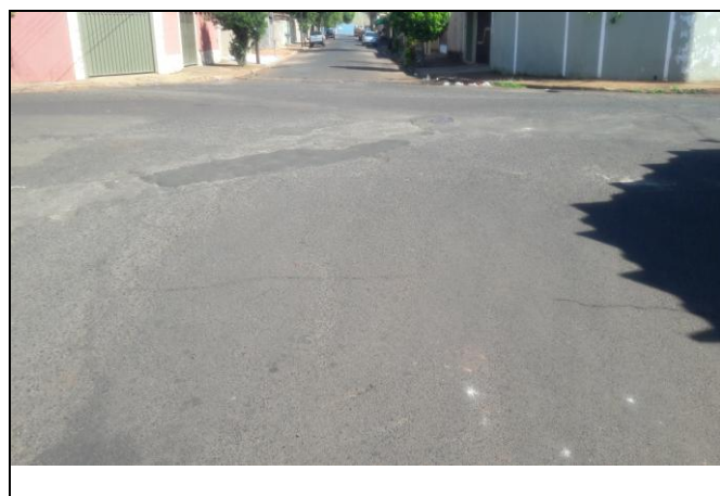
Foto 19: Vista de trecho da Rua José Marques Bairro: Vila Cláudia