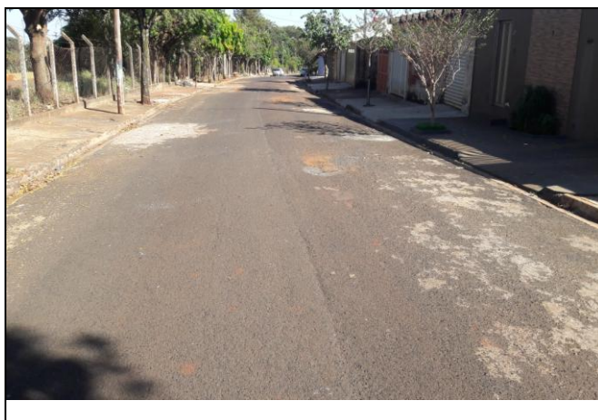
Foto 33: Vista de trecho da Rua José Bellini Bairro: Vila Cláudia