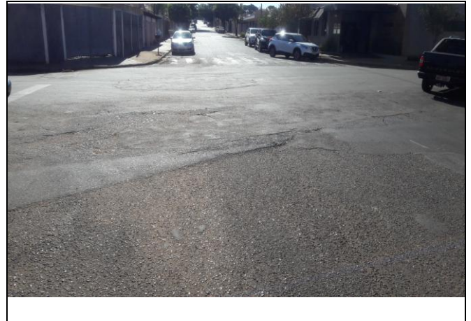
Foto 38: Vista de trecho da Rua Santi Pieri Bairro: Jardim Primavera