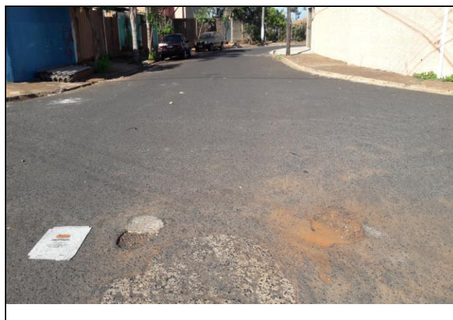
Foto 18: Vista de trecho da Rua Angelo Batiston Bairro: Vila Cláudia