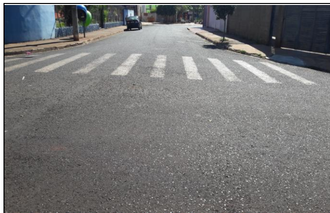
Foto 07: Vista de trecho da Rua Victório Molezini Bairro: Vila Cláudia