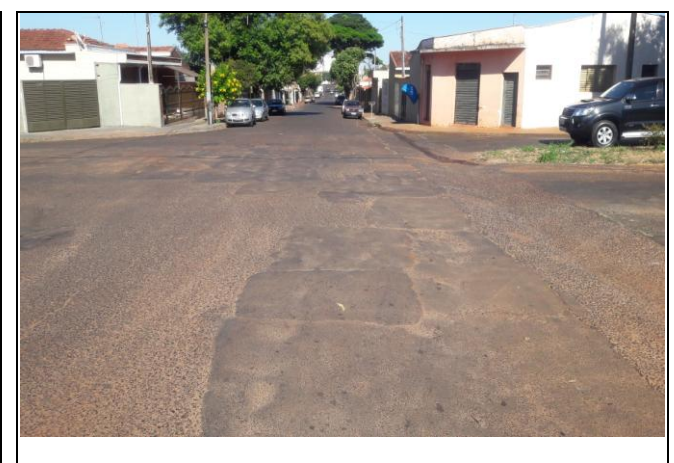
Foto 36: Vista de trecho da Rua Santi Pieri Bairro: Jardim Primavera