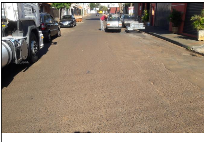
Foto 39: Vista de trecho da Rua Santi Pieri Bairro: Jardim Primavera