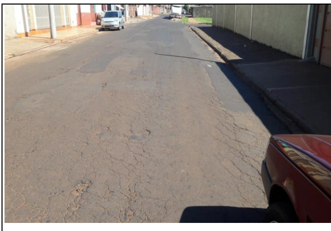
Foto 41: Vista de trecho da Rua Raulino de Medeiros Marques - Bairro: Nova Cravinhos

Cravinhos – SP, 11 de fevereiro de 2019.