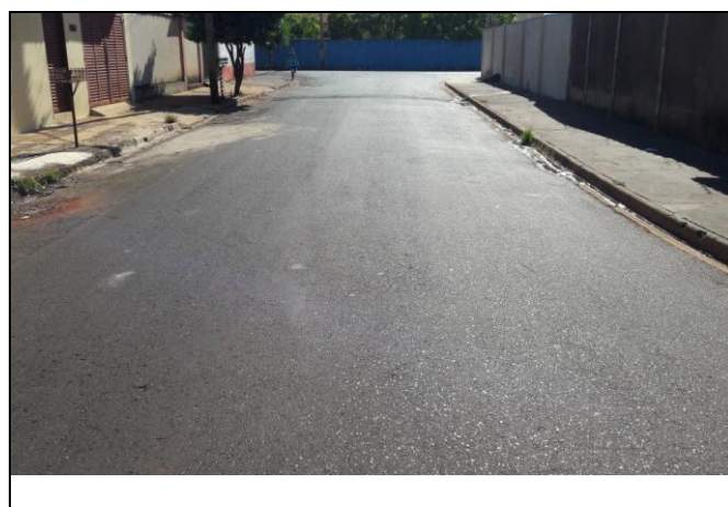
Foto 05: Vista de trecho da Rua João Bizutti Bairro: Vila Cláudia