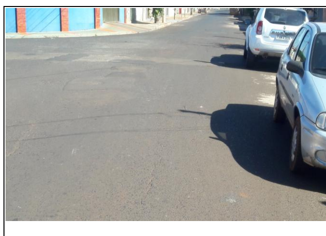
Foto 22: Vista de trecho da Rua Domingos Carloni Bairro: Vila Cláudia