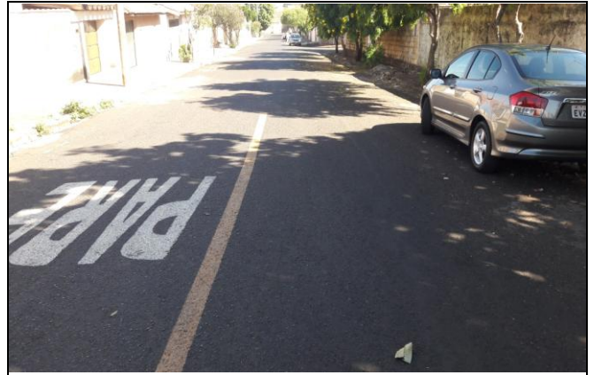
Foto 26: Vista de trecho da Rua Antonio de Oliveira Junior Bairro: Vila Cláudia