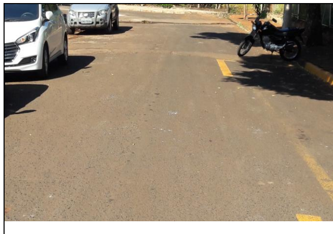
Foto 14: Vista de trecho da Rua Carlos Martinelli Bairro: Vila Cláudia