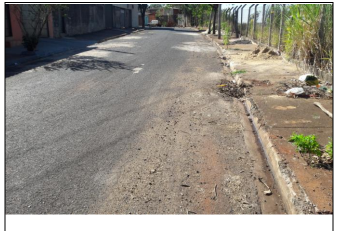
Foto 32: Vista de trecho da Rua José Bellini Bairro: Vila Cláudia