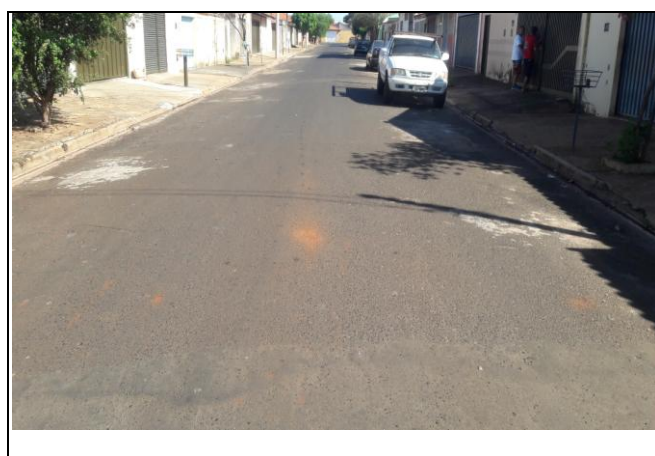
Foto 24: Vista de trecho da Rua Dr. Manoel Arantes Nogueira Bairro: Vila Cláudia