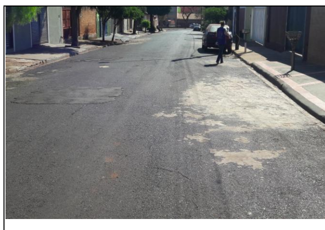
Foto 12: Vista de trecho da Rua Caetano Quálio Bairro: Vila Cláudia