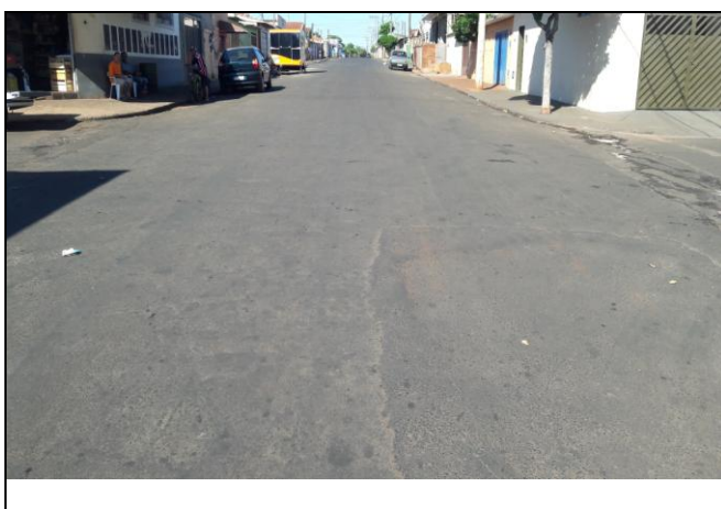
Foto 16: Vista de trecho da Rua Angelo Batiston Bairro: Vila Cláudia