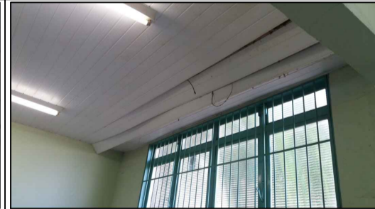
FORRO DA SALA DE TV SITUAÇÃO ATUAL