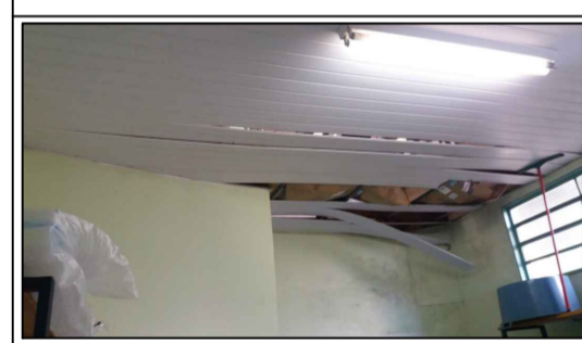
FORRO DESPENSA - SITUAÇÃO ATUAL