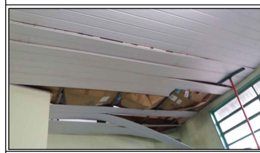
FORRO SALA DE AULA 04 SITUAÇÃO ATUAL