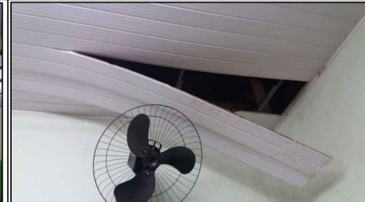
FORRO DA SALA DE BANHO DO BERÇÁRIO 01-SITUAÇÃO ATUAL