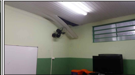
FORRO DA SALA DE TV SITUAÇÃO ATUAL