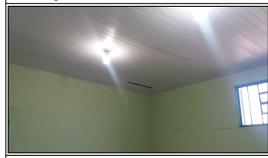
FORRO SALA DE AULA 04 SITUAÇÃO ATUAL