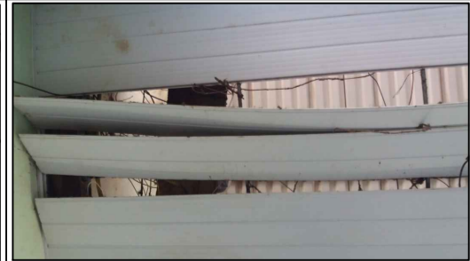
FORRO COZINHA 02 SITUAÇÃO ATUAL